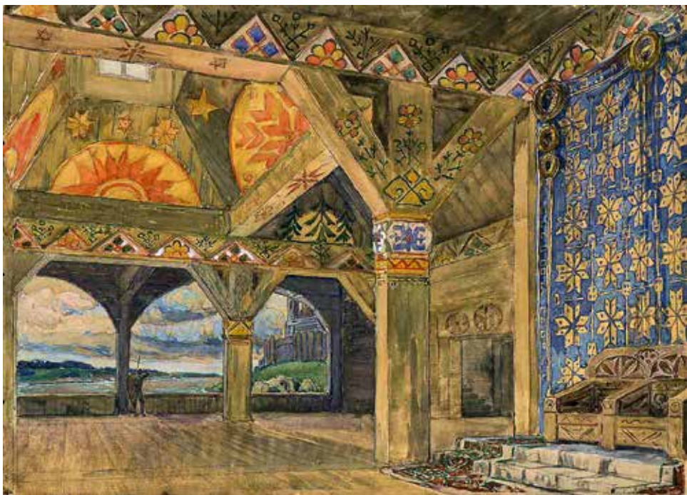
2. attēls. J. Kuga. Lielvārdes pils. Dekorāciju mets Raiņa lugas “Uguns un nakts” 5. cēlienam. Privāta kolekcija.

un noteica, ka tām ir jābūt senlatviešu stilā; arī tērpiem un iespējamam sienas paklājam 1 bija jābūt grezniem.