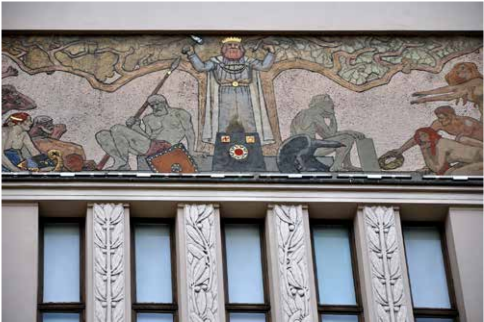
1. attēls. J. Rozentāls. Rīgas Latviešu biedrības nama fasāde. Polihromais panno “Spēks”, 1910. g.