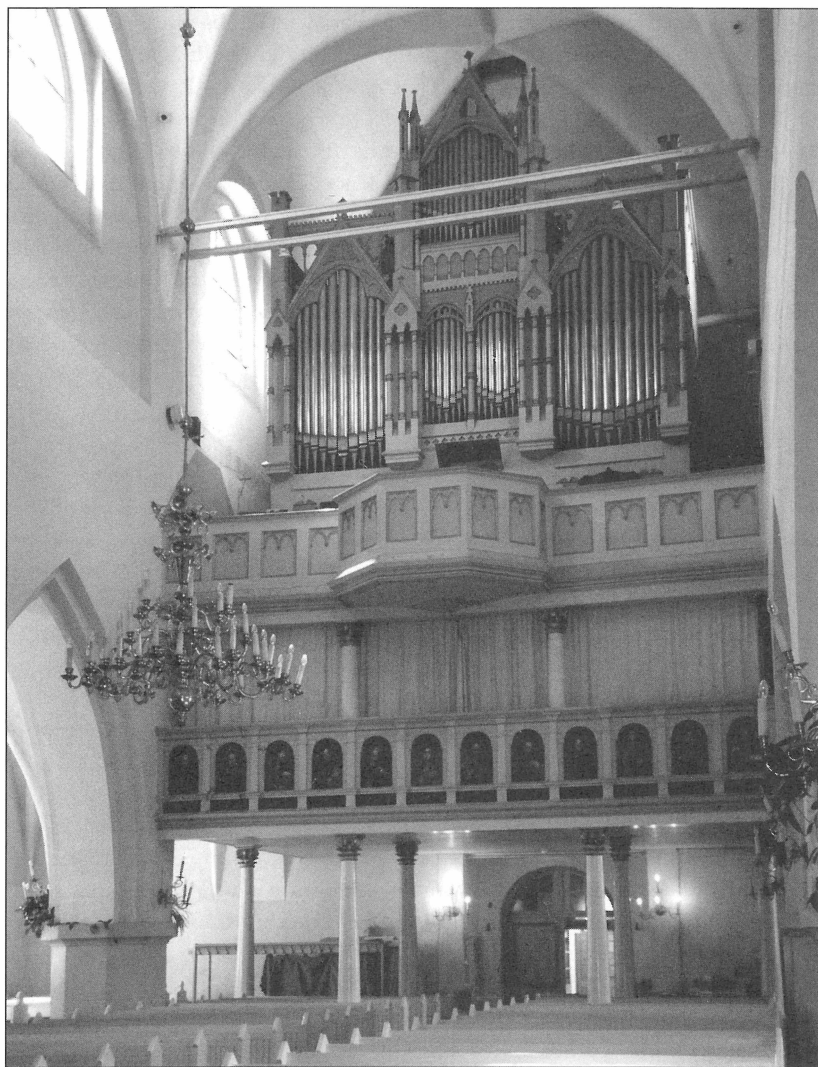
3. att. Ērģeļu lukta Valmieras Sv. Simona baznīcā. Šeit redzams balkons ar pildņiem, kas 17. gadsimtā kalpoja kā vieta dziedātāju grupai un ērģelēm. Fotografēja 2004. gada 11. aprīlī. Fotografēja I. Viļuma.

Fig. 1. The organ loft located in the St.Simon church of Valmiera city.