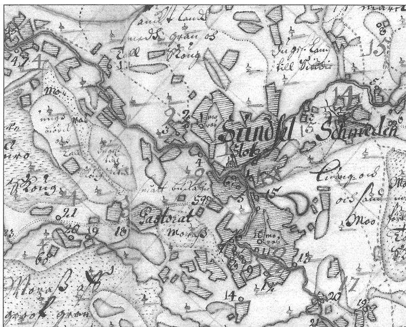
1. att. Suntažu novada zemes plāns (1683.). Oriģināls atrodas Latvijas Valsts vēstures arhīvā, 7404.f., 3.apr., 10.l. Attēlā iezīmēti zemes gabali Nr.18 un Nr.59, kas bija piešķirti lietošanai ķēsterim un skolmeistaram.

Fig. 1. Map of Suntaži rural parish (1683). The pieces of land marked in the picture belonged to sacristans and schoolmasters.