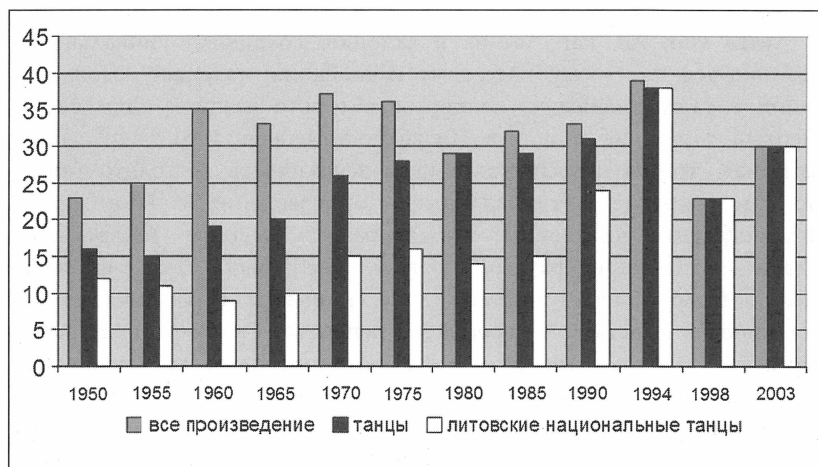
1-ый график. Произведения Дня танца.

Из 1-го графика видно, какая тенденция была приоритетной на Празднике танца. На первых Праздниках танца (до 1965 года) увеличивалось общее число различных произведений и, в то же время, уменьшалось количество исполняемых национальных танцев. Однако уже с 1980 года на Праздниках танца национальные танцы занимали почти половину программы, а также увеличилась доля хореографических произведений в общей программе. Во время последних Праздников уже были показаны только литовские национальные танцы, а самое большое количество танцев было исполнено в 1994 году.