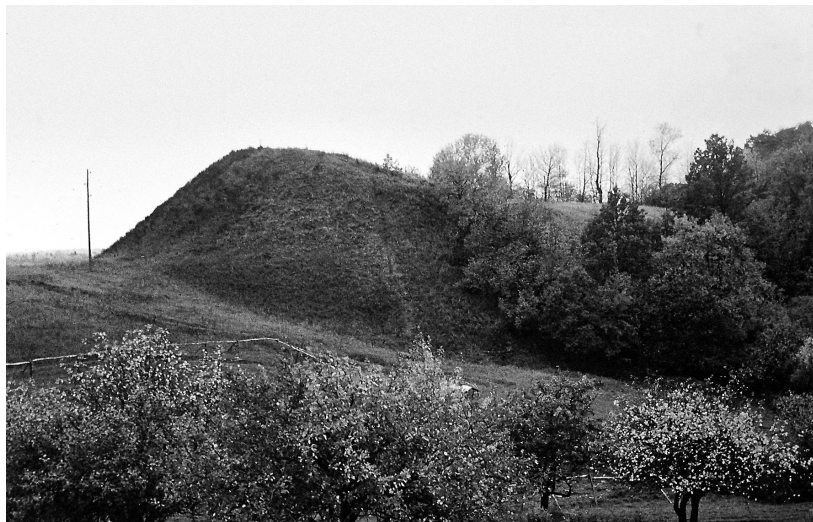
3. att. Vītiņu Incēnu pilskalns. V. Urtāna foto, 1971.