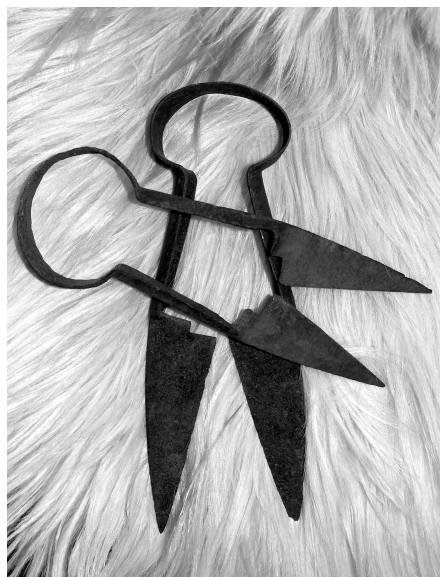
1. att. Etnogrāfiskās dzirkles no autora kolekcijas.

Dzirkles (1. att.) ir darbarīks, kas paredzēts plānu materiālu (audumu, vilnas u. tml.) griešanai un kas sastāv no diviem, vienam pret otru nostatītiem asmeņiem, kuru darbība pamatojas uz atsperes vai sviras principu. Dzirkles parādās Mezopotāmijā 13. gs. p. m. ē.; Eiropā pirmie atradumi attiecas uz pēdējiem gadsimtiem p. m. ē. Dzirkles parasti darina no dzelzs, retāk no bronzas. Latviešu valodā parastākais šā instrumenta nosaukums ir dzirkles , bet ir fiksētas arī vārda formas dzirklis , dzirkļi ( Dzirkles , 1929–1930). Latviešu valodā