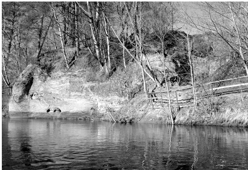
1. att. Kuiķuļu klints un Lībiešu Upuralas. Skats no Svētupes.