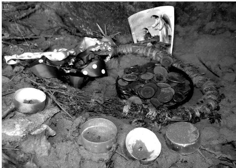
5. att. Mūsdienu ziedojums pie Lielās Lībiešu Upuralas ieejas. S. Laimes foto, 2014.

2) Ziedojumi, ko alās atstājuši dažādu folkloras, neopagānisko, ezotērisko un citu kustību pārstāvji (4., 5. att.). Šo kustību (at)dzimšana Latvijā attiecināma uz 20. gs. 90. gadiem. Atšķirībā no tūristiem, šo Lībiešu Upuralu apmeklētāju veiktās darbības un rituāli ir daudz komplicētāki, to nodrošināšanai veikta