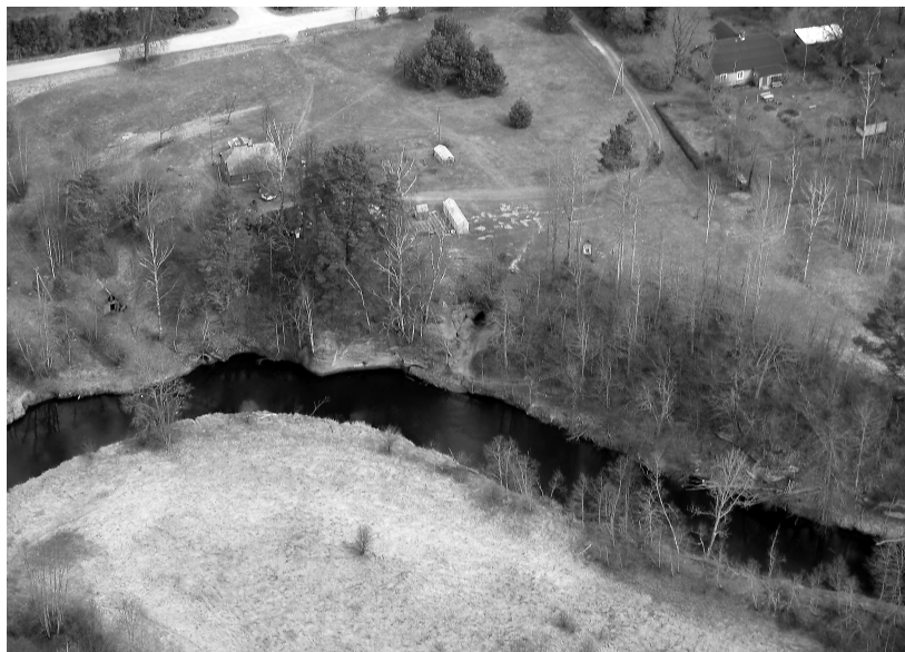
2. att. Svētupes Lībiešu Upuralas. Skats no putna lidojuma.

datējamas senlietas, starp kurām seši bronzas pirkstu gredzeni vai to fragmenti, bronzas riņķasakta un tās fragments, divi bronzas apkalumi, divi bronzas zvārguliši, dzelzs jostas sprādze, kaula šujamadata, trīs holandiešu pipju kātu fragmenti, dzelzs āķis, kas varēja būt gan bezmēna āķis, gan kāsis katla iekāršanai virs uguns, gan vēl citas nozīmes priekšmets. Jau pēc izrakumiem tika apskatīta un noteikta vēl viena 17. gs. monēta, kas bija atrasta no alas izmestajās zemēs; tātad kopējais arheoloģiskajos izrakumos atrasto un noteikto monētu skaits bija 629 monētas. Tāpat kultūrlānī uzietas organiskas cilmes ziedojumu atliekas: vaska gabali, putnu kauli, olu čaumalas, zivju zvīņas un asakas, savukārt par to, ka alās kurināta uguns, liecināja daudzas sīkas ogļītes (Urtāns, 1980).