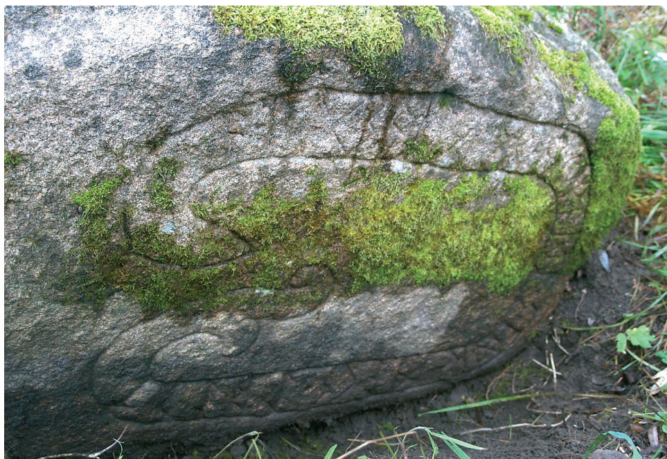
2. att. Liezēres rūnākmenis.