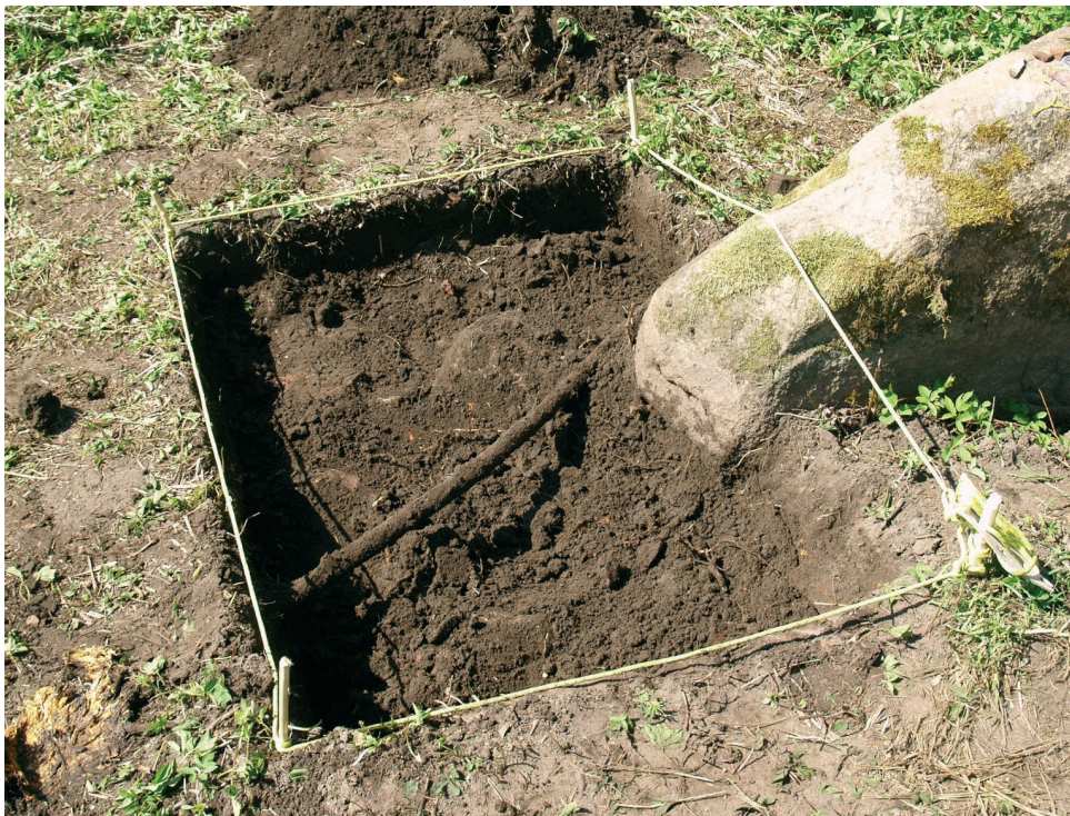
4. att. Pārbaudes rakuma virskārta.

Noskaidrojās, ka pie akmens ir 0,15 m bieza, melnā augsnē veidojusies velēnas kārta, zem kuras līdz 0,55 m dziļumam turpinās melnas zemes, respektīvi, augsnes kārta (5. att.). Tajā daudz šķeltu, nekārtībā gulošu dažāda lieluma akmeņu, arī lielāki un mazāki ķieģeļu fragmenti (ķieģeļu platums 12 cm), jaunāku laiku draža – vāpētas trauku lauskas, stikla glāzītes pēdiņa, divi lielāki elektrības kabeļa fragmenti dzelzs apvalkā. 0,30 m dziļumā melnajā zemē parādījās atsevišķi māla ieslēgumi. Pārbaudes rakuma austrumu pusē netraucēta māla pamatzeme atsedzās 0,55 m dziļumā, bet pārbaudes laukuma vidusdaļā veidojās asa robeža starp pamatzemes mālu austrumu pusē un dziļāk esošu kultūrslāni rietumu pusē.