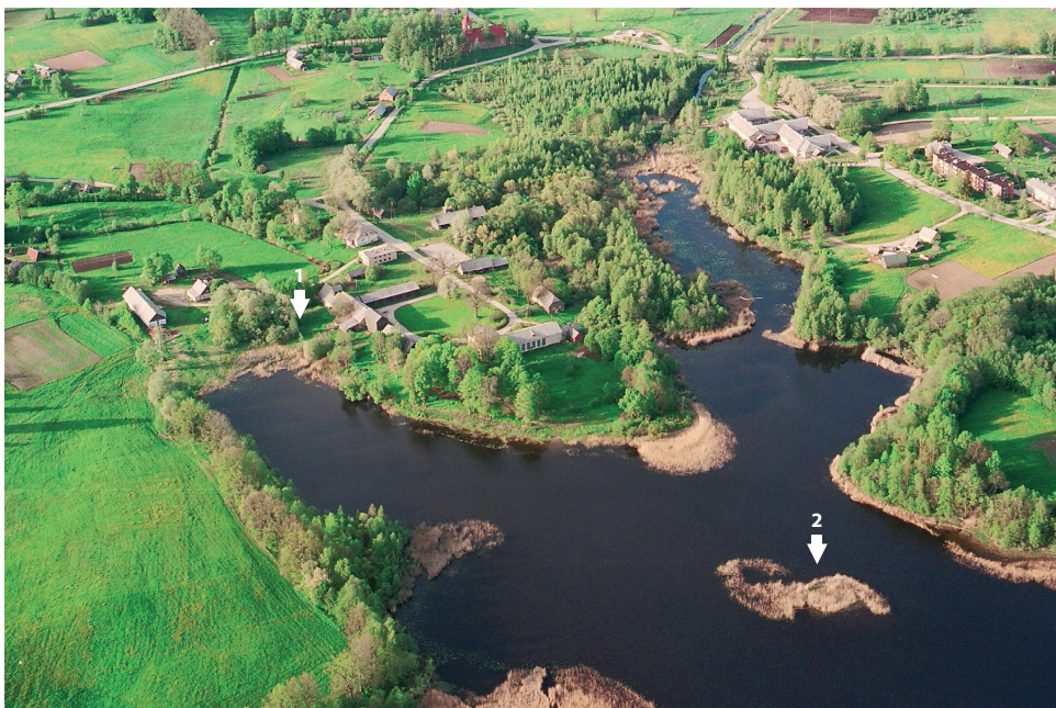
6. att. Skats uz Liezēres muižu no putna lidojuma.

1 – Liezēres rūnakmens; 2 – Liezēres ezermītne. Autori: Juris Urtāns, Rihards Delvers.