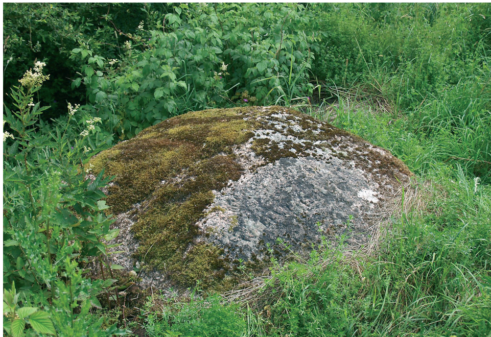
1. att. Jeru Apsīšu akmens ar rūnu atdarinājumu iekalumu.